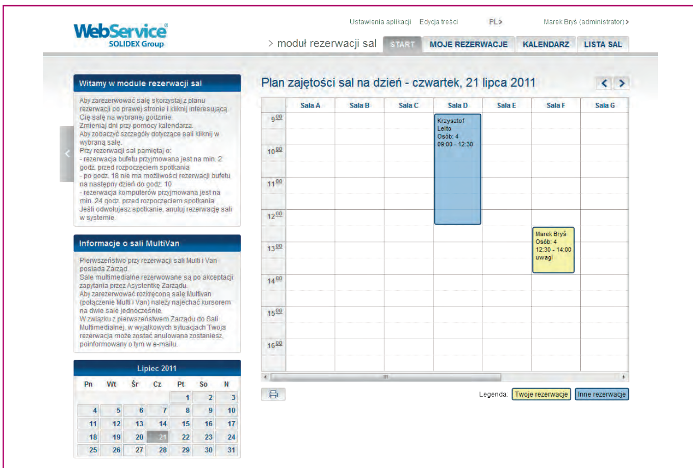
Rys.2. Siatka rezerwacji

nić można m.in. szczegółowy widok zajętości sal na dany dzień (widok taki Receptja może wydrukować na wybrany w kalendarzu dzień) oraz dostęp do listy wszystkich rezerwacji wraz z możliwością ich usuwania.