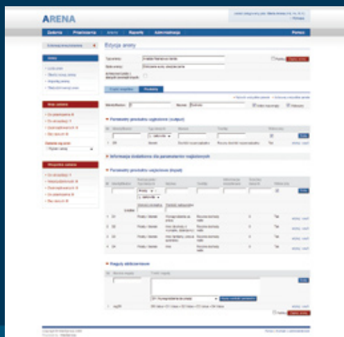
Rys. 3 Edycja algorytmów i pól formularzy (wersjonowanie)

Głównym zadaniem ARENY jest ułatwienie, porządkowanie i automatyzowanie pracy Agentów (Doradców Klienta) a także dostarczenie zestawu niezbędnych zagregowanych danych managementowi oraz innym systemom.