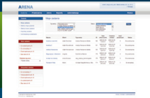
Rys. 1 Widok główny - „Moje zadania”