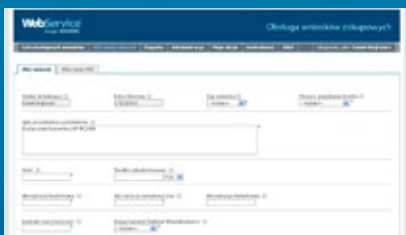
Rysunek 1. Nowy wniosek zakupowy