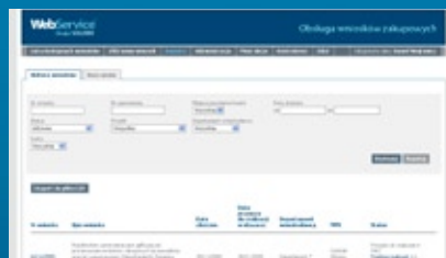
Rysunek 2. Raporty dla managementu